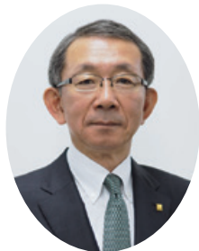
代表取締役 会長兼社長執行役員