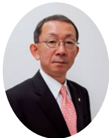
代表取締役 社長執行役員